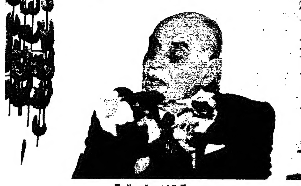
الرئيس صائب سلام

انتهى التسرع الثالث على الآلة الوزارية دون ان يطرأ اي تعديل أساسي على مواقف الفرقاء. وفيما كانت الآلة تسلك اطار التفاضل تتقيد نواحي الاجراء مسالمة بمخالفة اجراء مسالمة سياسية تتقيد نواحي الاجراء مسالمة وزع تصريح للمزيد ريمون آده الذي قبل سفره أمس. قال فيه «ان الآلة اصبحت بين سبر الرشيد ونولزير طوني». وقد رد الرئيس كرايحي على هذا التصريح بقوله: ان المزيد آده محبتي وحلفي قد اعلن قبل سفره بصريح مطول يرضي انكره وتصويره. وقد كان لنا اجتماع منذ يومين شرحت فيه الموقف من كل نواحيه. وكنت أود ان اتكلم من ازالة كل ما يثور نسي الدهان الناس اليوم. وقال كرايحي انه لم يجر بحث بالاسماء وان الاهتمام منصب على تاليف حكومة يرضى بها الجميع. وقال الرئيس كرايحي في تصريح ردا على سؤال عن رايه بصريح آده: انني اشعر مع المواطنين جميعا بما حل في لبنان من شرر وماسي نسي يداب على الخروج منها ويسرع وقت. هذا الوطن. ومن أجل كل جيب اياته. ان انه بلحمة وحدها وبقلة يكن ان نبي هذا المنهج على أسس العدالة والخير. بحيث تحقق الجمال والجمالي التي نسير نحوها الجميع وهذا بالطبع لا يمكن ان يتحقق بالاعتقال والاحتقاد. ولكن كل هذا على هذه المعنى. لان الشعب نسي بدأ بل ويشعر من هذه الحالة المؤلمة التي وصلنا اليها. ولذلك نعتبنا قوت ان نتجسس المسؤولية في هذه المرحلة بالذات. فإنا التيبة على ص ٨ عمود ١٥٧ طوني فرنجييه: موعدي مع العميد بعد عودته ابن السيد طوني فرنجييه مساء ابن بصريح تعليقا على حديث العميد التيبة على ص ٨ عمود ٢